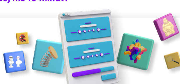
Deloitte zaczyna używać GoodHabitiz assessments.

aktywnych użytkowników korzysta z testów. 2 ukończone testy na pracownika (średnio).